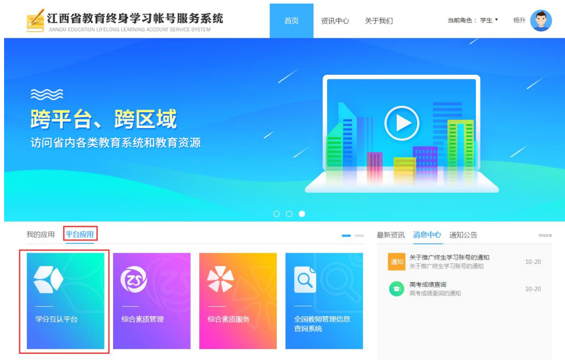
图1-3 终身学习账号服务系统登录后的界面

点击右上角“登录”按钮，进入如图 1-1 所示登录界面，输入“终身账号”及“密码”后进入如图 1-3 所示终身学习账号服务系统登录后界面。